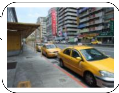
捷運端停靠站： 3號出口計程車排班區後方