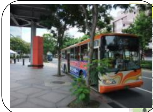
世貿端停靠站： 市府路東側天橋下