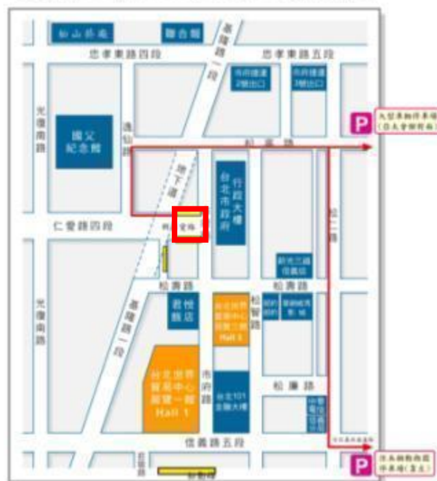
遊覽車臨停上下客及停車處標示圖

展前發函教育部及參展單位，請參觀團體前往世貿展1館之遊覽車利用 新仁愛路南北兩側上下客 ，前往南港展覽館之遊覽車利用展覽館正門前停靠彎內側接駁巴士區上下客，並於該路南北兩側設置告示牌引導，位置請詳下圖紅框處所示。並通知參觀團體離開展館時，請先集合完畢，後請遊覽車前往載客，並請盡量縮短遊覽車停留之時間，以降低車輛對周邊道路造成之影響。